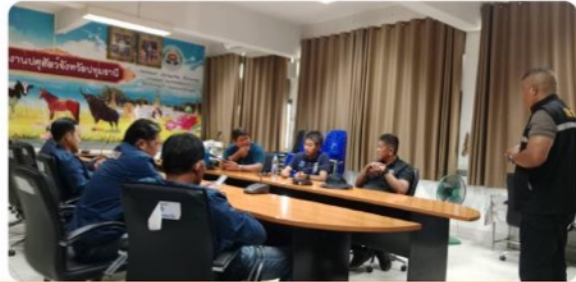
กิจกรรมการเข้าตรวจสอบห้องเย็น และสถานที่จำหน่ายอาหาร (Food Service)